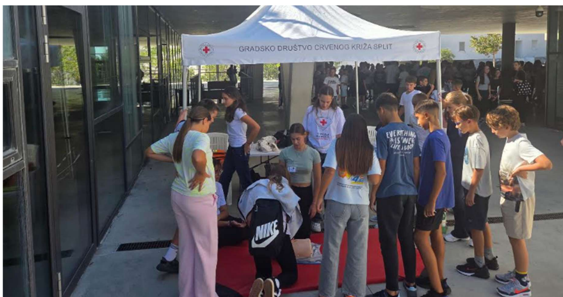
Slika 1. Obilježavanje Svjetskog dana prve pomoći , rujan 2025.

Svake godine diljem svijeta druge subote u rujnu obilježava se Svjetski dan prve pomoći . Obilježavanje Svjetskog dana prve pomoći je zajednička akcija svih društava Hrvatskog Crvenog križa. Prilika je to za isticanje važnosti prve pomoći na globalnoj razini kao humanog čina, a uključivanjem šire javnosti utječe se na promjene u razmišljanju o značaju prve pomoći u svakodnevnom životu. Povodom obilježavanja Svjetskog dana prve pomoći, za učenike i učenice Osnovne škole Žnjan-Pazdigrad, organizirana je edukativna prezentacija pružanja prve pomoći u slučaju pada s romobila, s posebnim naglaskom na prepoznavanje i pravilno zbrinjavanje najčešćih ozljeda. Učenicama i učenicima su prikazani osnovni postupci procjene stanja unesrećene osobe, zaustavljanja krvarenja, imobilizacije kod sumnje na prijelome te pravilnog pozivanja hitne medicinske pomoći. Ova je tema odabrana zbog vidljivog i drastičnog porasta ozljeda uzrokovanih padom s romobila, osobito među djecom i mladima, zbog čega je dodatno naglašena važnost poznavanja osnovnih vještina prve pomoći u svakodnevnim situacijama.