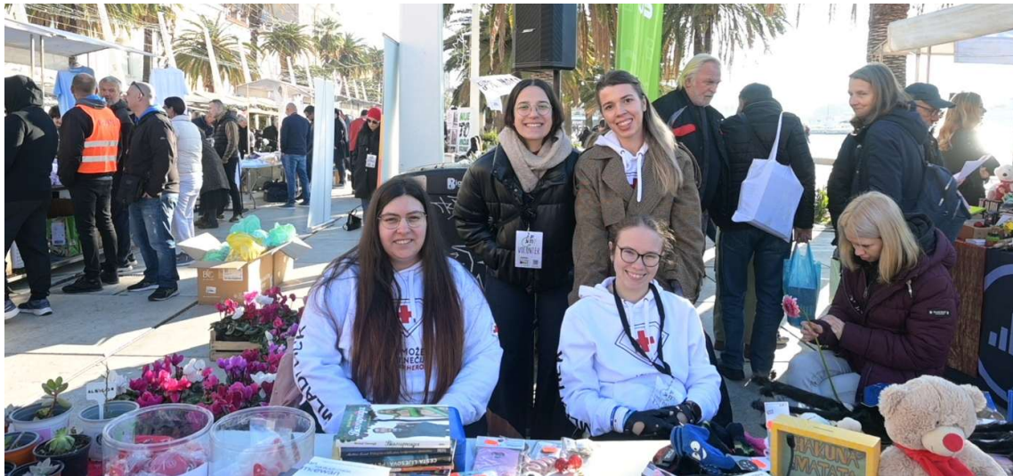
Slika 5. Humanitarna akcija „ A di si ti? “, prosinac 2025.

U okviru projekta Posudionica medicinskih i ortopedskih pomagala, građani mogu donirati te besplatno posuditi i medicinska pomagala (medicinski kreveti, invalidska kolica, štake...) što je u ovakvim financijski teškim uvjetima veoma značajno obzirom na tržišnu cijenu istih. U izvještajnom razdoblju navedenu uslugu potražilo je 76 korisnika . S obzirom na konstantno rastuću potražnju za medicinskim i ortopedskim pomagalima, u izvještajnom razdoblju nabavljeno je dodatnih 10 medicinskih kreveta u vrijednosti 5.156,25 EUR.