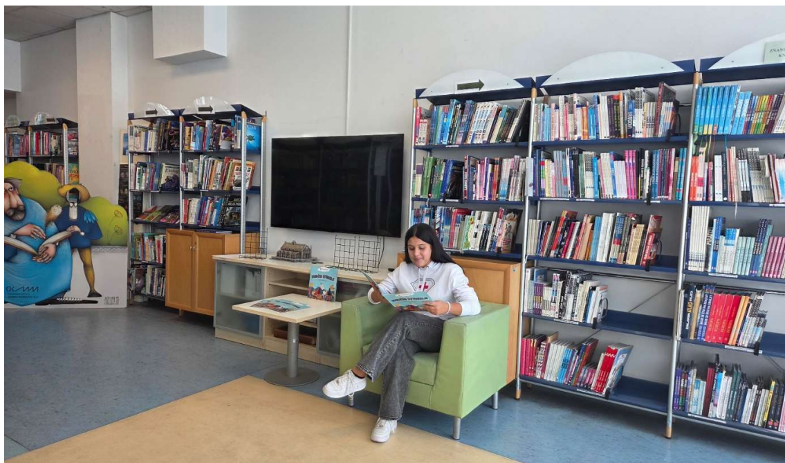
Slika 6. predavljanje slikovnice „Neobično putovanje“, listopad 2025.

Kao osnovu za odličnu uvježbanost ekipa prve pomoći, osim vježbi i redovnog obnavljanja znanja, jest i poznavanje realističnog prikazivanja ozljeda. Riječ je o izradi vrlo uvjerljivih simulacija rana, prijeloma, opekline i drugih ozljeda pomoću šminke, umjetne krvi i različitih materijala. Svoju kreativnost, preciznost i vještine naša je ekipa imala priliku pokazati na natjecanju koje je u rujnu održano na Sljemenu u Zagrebu. Njihov trud, timski rad i posvećenost nagrađeni su osvajanjem izvrsnog 2. mjesta, na što smo iznimno ponosni.