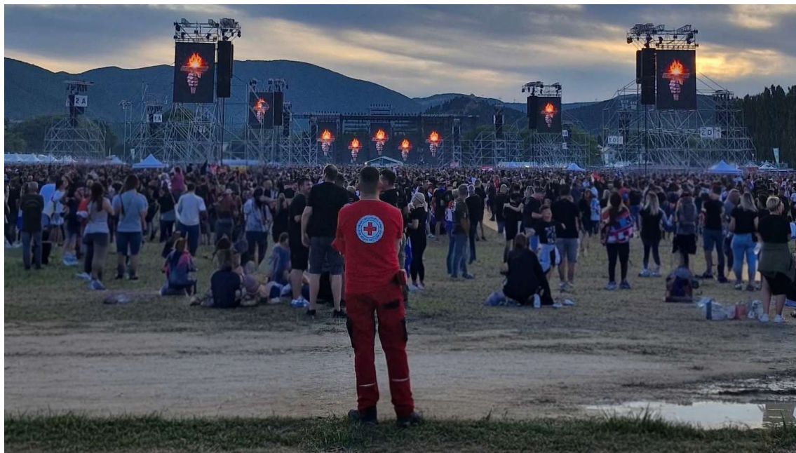
Slika 7. Interventni tim Splitsko dalmatinske županije na sinjskom Hipodromu

Članovi interventnih timova iz cijele Splitsko-dalmatinske županije u kolovozu su se okupili na sinjskom hipodromu kako bi tijekom koncerta Marka Perkovića Thompsona osigurali pomoć i podršku posjetiteljima. Volonteri i djelatnici Gradskog društva Crvenog križa Split, njih 11, bili su raspoređeni na deset fiksnih lokacija unutar Hipodroma gdje su, s timovima Hitne medicinske službe, pružali pomoć svima kojima je zatrebala medicinska skrb.