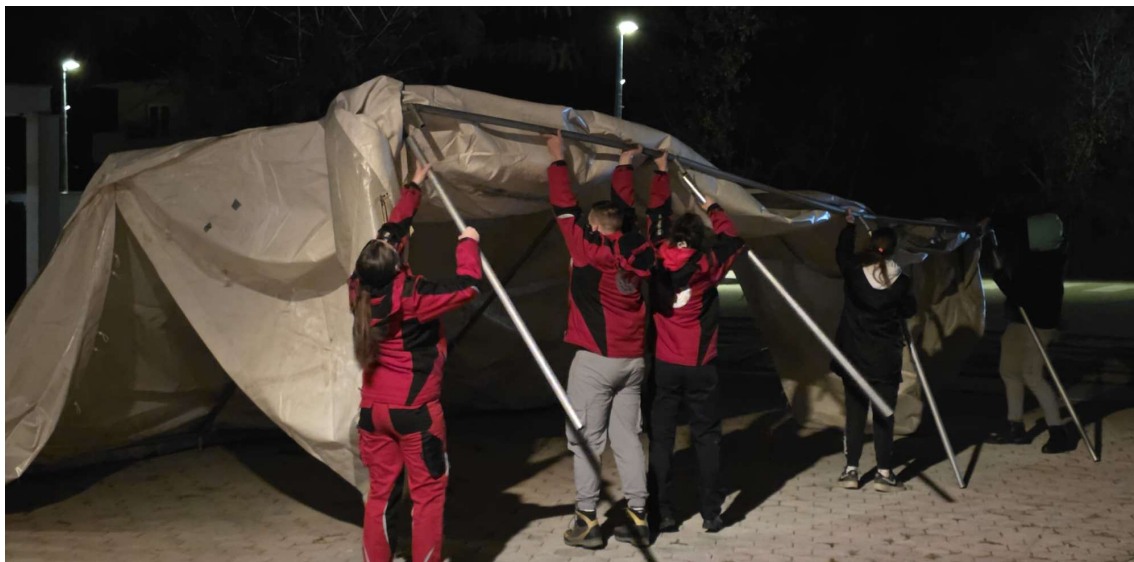
Slika 8. Zajednička županijska vježba Imotski 2025. , studeni 2025.

Zajednička županijska vježba „IMOTSKI 2025.“: u studenom je u općini Runovići održana dvodnevna terenska vježba u organizaciji Društva Crvenog križa Splitsko-dalmatinske županije. Pripadnici interventnih timova obnovili su znanje iz područja procjene situacije, službe traženja, radiokomunikacije, logistike, sklaadišnih poslova, prve pomoći, organizacije smještaja, psihosocijalne podrške te drugih važnih aktivnosti koje Crveni križ provodi u kriznim situacijama. Uz edukativne radionice, održana je i noćna pokazna vježba koja je bila zasnovana na realnoj opasnosti od potresa.