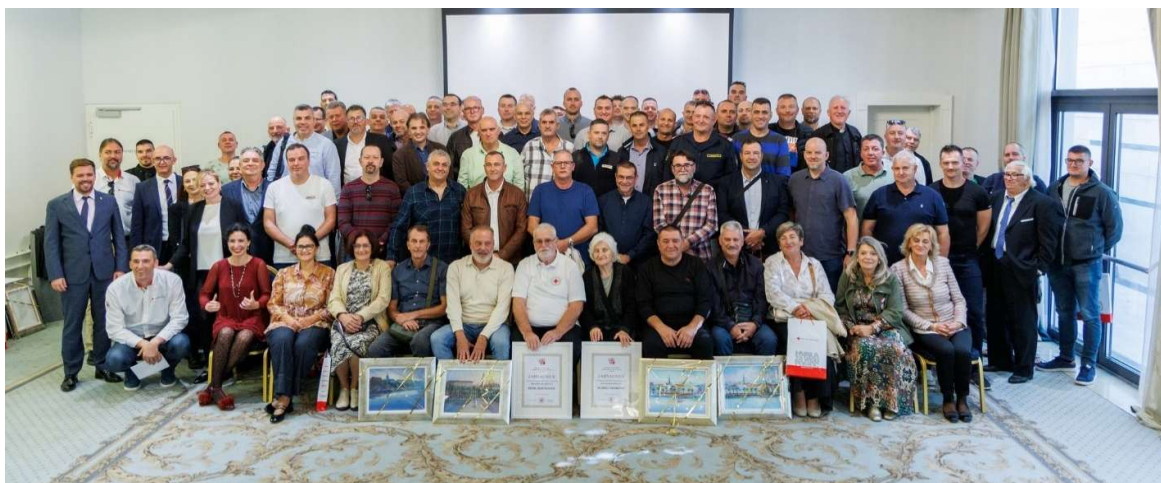
Slika 4. Dodjela priznanja dobrovoljnim darivateljima krvi, listopad 2025.

Na inicijativu Gradskog društva Crvenog križa Split, Grad Split donio je službenu odluku o dodjeli javnog priznanja " Zahvalnica Grada Splita " petorici dobrovoljnih darivatelja krvi koji su svojim iznimnim humanitarnim djelovanjem ostvarili 100 darivanja krvi. Uz svečanu Zahvalnicu, nagrađenim darivateljima isplaćena je i novčana nagrada u iznosu od 1.000 eura neto. Darivanje krvi je čin koji nema osobnu korist za darivatelja, ali ima izravnu, a često i presudnu, korist za nepoznate ljude. Kada jedinica lokalne samouprave takve ljude javno prepozna i zahvali im, šalje snažnu poruku o vrijednostima koje njeguje – brigu za druge, zajedništvo i odgovornost prema zajednici. Time se ne odaje priznanje samo pojedincima, nego se gradi kultura solidarnosti i potiče druge građane da slijede njihov primjer.