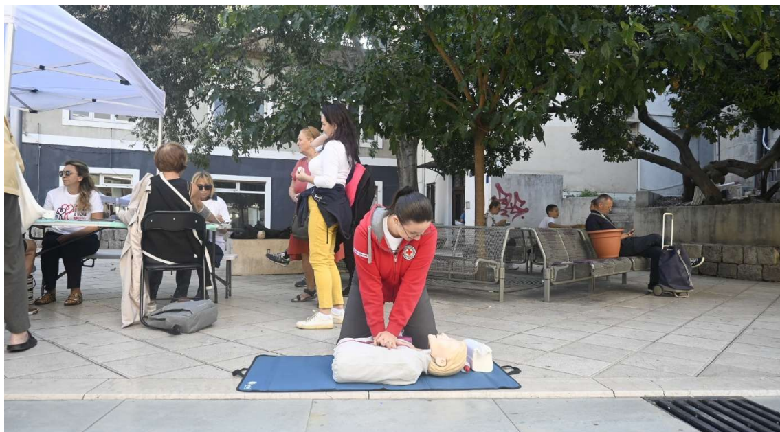
Slika 2. Obilježavanje Svjetskog dana srca , rujan 2025.

života, volonteri Gradskog društva Crvenog križa Split pokaznim su vježbama educirali građane o postupcima oživljavanja i prve pomoći.